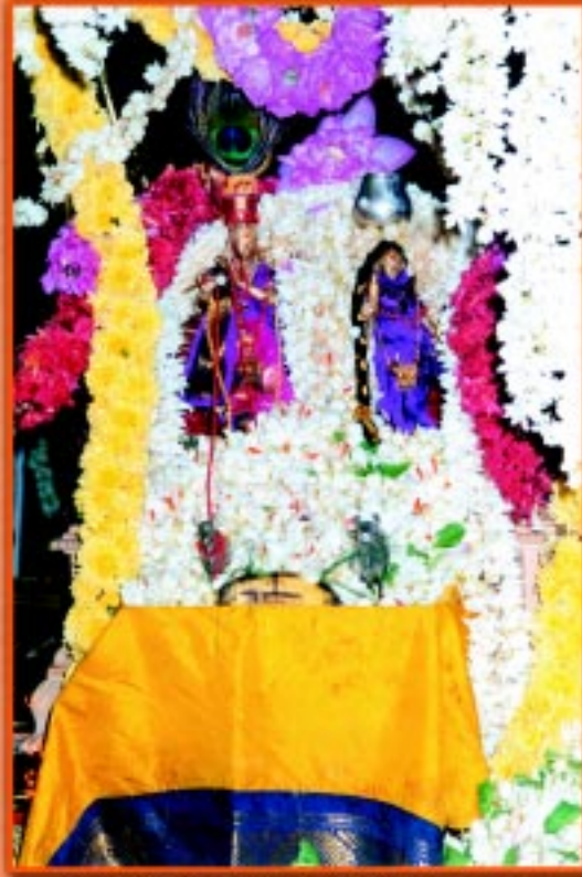
பார்த்தசாரதி மடத்துக்கு அர்ச்சனையின்போது